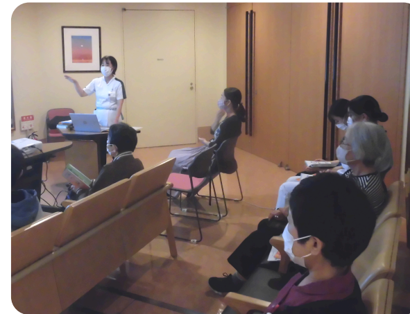
※専門・認定看護師ミニレクチャーの様子

2024年10月から5名の専門・認定看護師が専門性を活かしたミニレクチャーを開始しています。私は慢性疾患看護専門看護師として、11月に糖尿病と高血圧について説明しました。糖尿病は血糖値を下げるホルモンのインスリンの分泌が悪かったり効きが悪かったりして血糖値が上がりやすい病気です。高血圧は自覚症状がほとんどありませんが、治療をしないで放置していると心臓、脳、腎臓に影響が出て身体がしんどくなります。血糖が上がりにくい、血圧が上がりにくいなどの自分の身体の特徴を知ってうまく付き合っていく、受診の時には医師に自分の体調で気になるところを相談して、早め早めの対処をとることで元気に過ごすことができると思います。「一秒息災」は、一つぐらい持病があるほうが健康に気を配りかえって長生きをすることです。病気とうまく付き合っ、元気に過ごしてほしいと思っています。