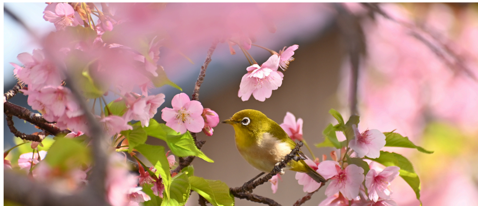
撮影場所：渥美半島（愛知県田原市）

〒466-8633 名古屋市昭和区川名山町56番地 Tel: 052-832-1181 https://www.seirei-hospital.org