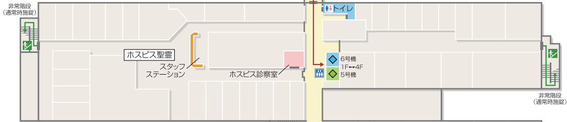
2号棟 アーノルド館